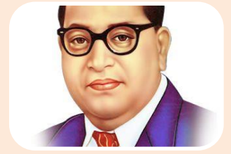
डा. भीमराव आंबेडकर